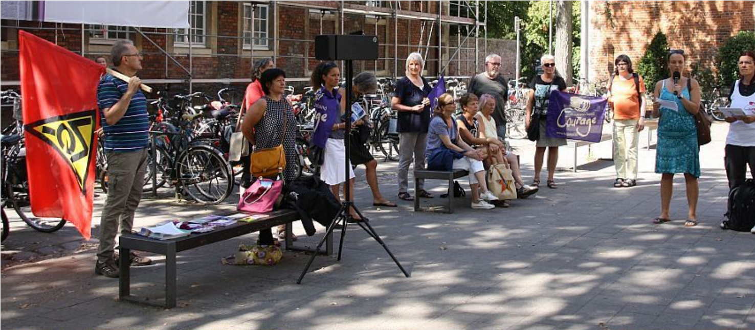
Bericht zum Film laden/Ausdrucken