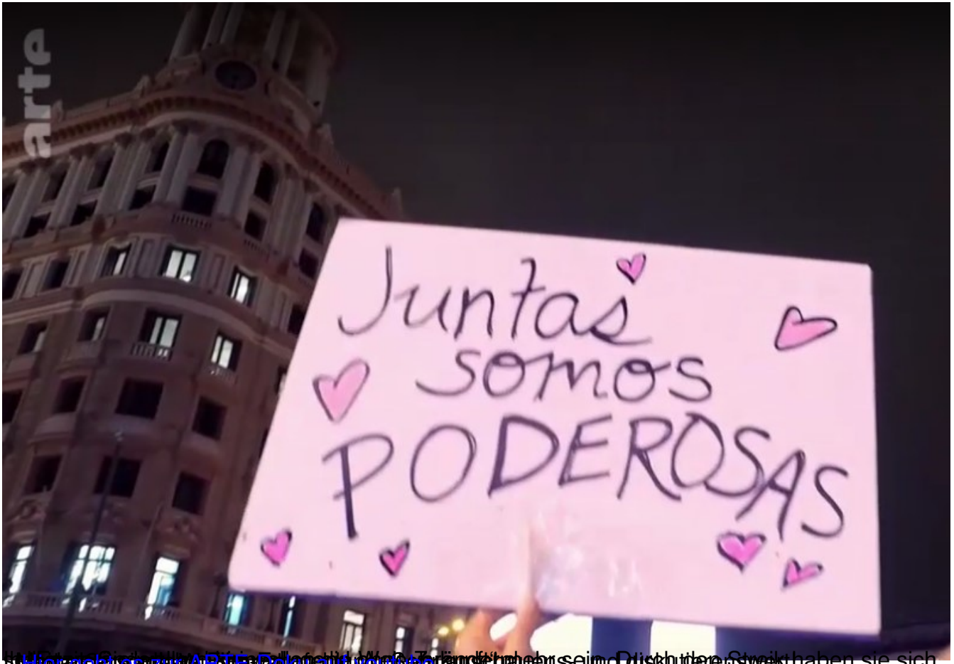
Hier klicken zum ARTE Dok all you see und schauen sie sich das Diskutieren was haben sie sich